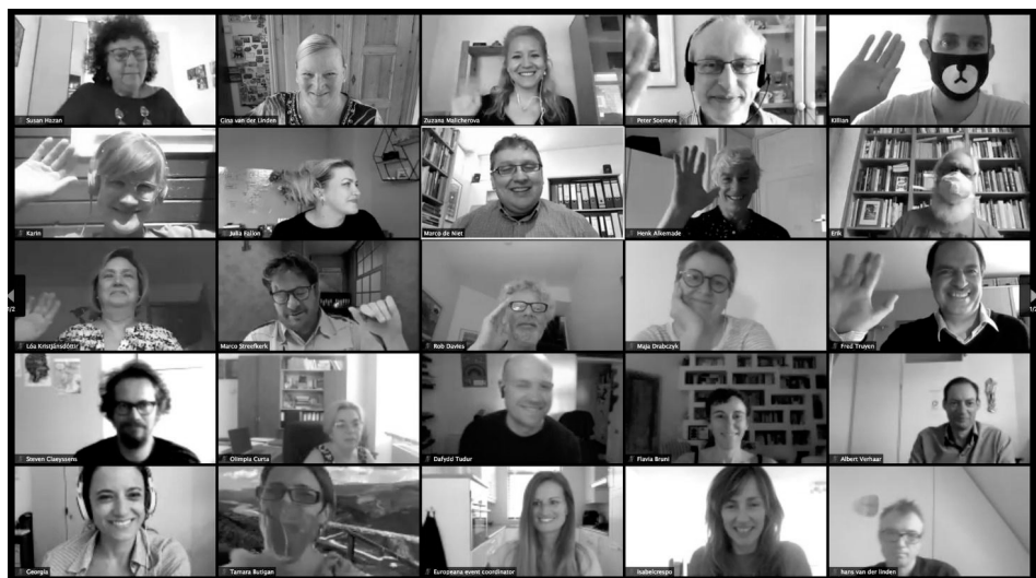
Фотографија једног броја учесника онлајн састанка Савета чланова Асоцијације Мрежа Европеана